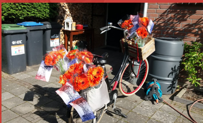
► De fiets van Wietse was volgeladen met bloemen