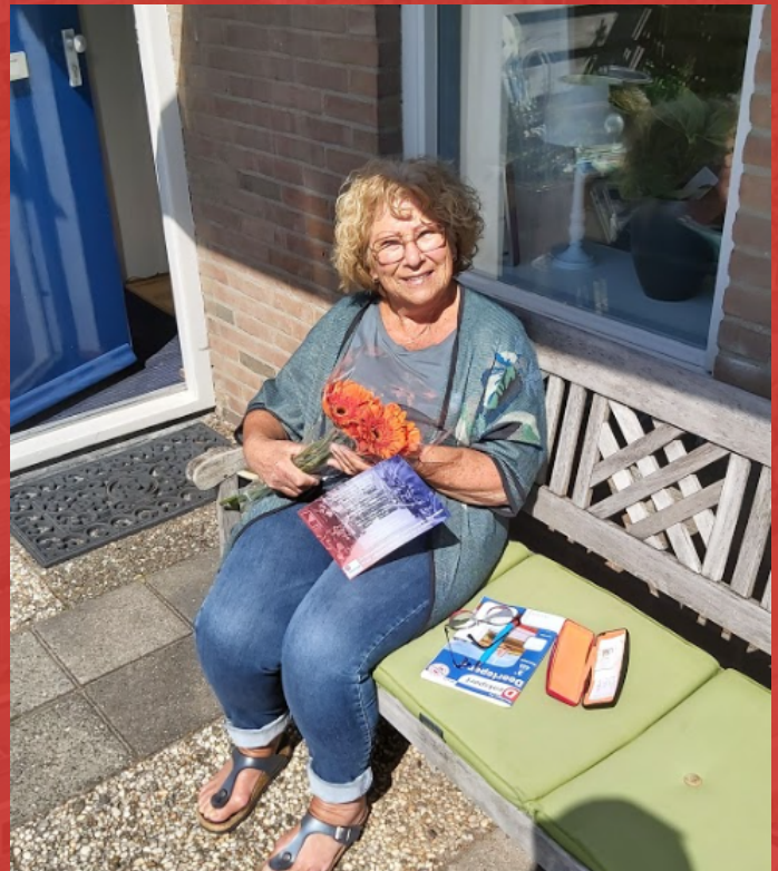
► Een gemeentelid genietend in de zon met de bloemen

We waren erg verrast met de oranje gerbera's. Een bijzonder leuke geste en zeer gewaardeerd door ons!