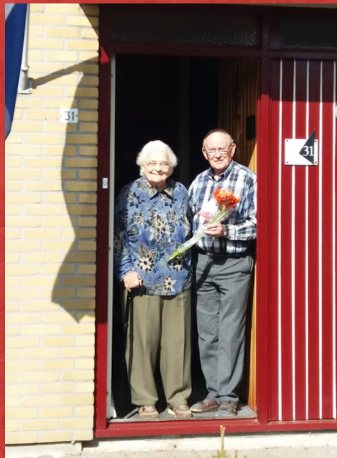
► Twee gemeenteleden waren erg blij verrast met de bloemen