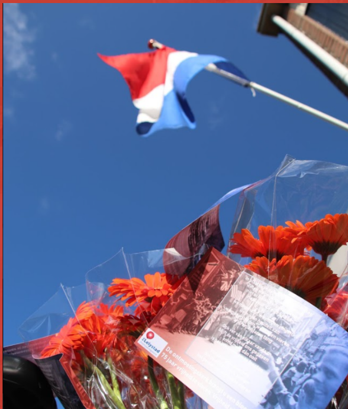
► De vlaggen hingen uit om de vijftienseventig jaar aan vrijheid te vieren